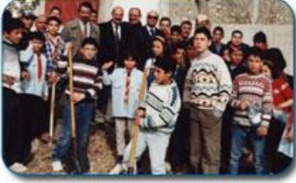
المشاركة في حملات النظافة

انطلاقاً من الأهمية البالغة و العناية الموصولة التي حظيت بها هذه الشريحة ونظراً للنتائج الإيجابية التي حققتها المجالس البلدية للأطفال و مساهمتها الفعالة في إنكاء روح المواطنة و تثبيت القيم لدى الناشئة ، فقد حرصت بلدية لمطة على أن يكون دور المجلس البلدي للأطفال رائداً و مثالا يحتذى به.